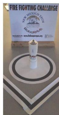
Pozice s jednou stěnou