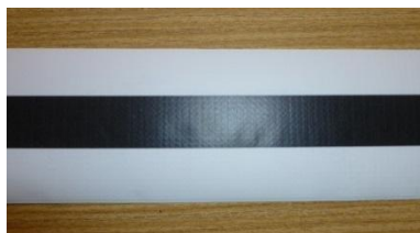
Hraniční čára hřiště svíčky